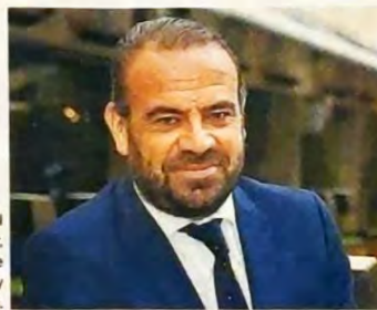
Gabriel Escarrer, vicepresidente ejecutivo y CEO de Meliá.

Meliá y NH se han lanzado a una batalla judicial contra el Gobierno por los daños provocados por las medidas llevadas a cabo durante el primer estado de alarma. Meliá reclama una indemnización de 116 millones y NH algo más de 100 millones. Ambas cadenas hoteleras sufrieron grandes pérdidas económicas por los cierres de hoteles entre el 14 de marzo y el 21 de junio de 2020. P3/LA LLAVE